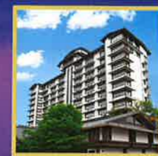
上諏訪温泉 浜の湯