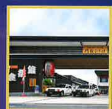
諏訪大社秋宮前 食祭館