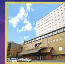
上諏訪温泉 RAKO華乃井ホテル